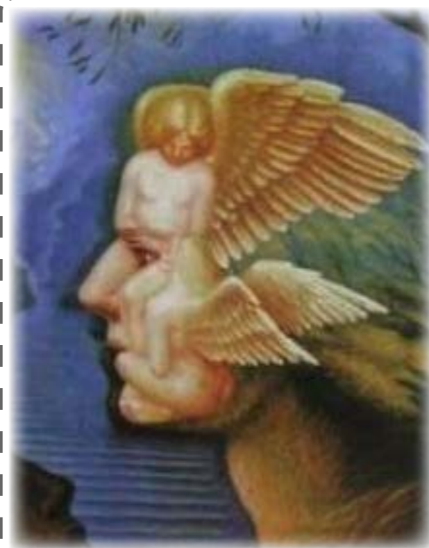
该图源自英国怀特海《教育的目的》一书封面

何谓前所未有？我的个人的解读，要做不一般的人，要做不一般的组织，更要做不一般的事！只有这样，才能应对未来的“危”和“机”。达成这样的目标，谈何容易？如何将不可能的事情办成可能？我的答案是：需要有一批傻傻坚持和默默专注的团队，努力向7*24小时工作状态前行，定能为行业创造价值，提供行业进步的原动力。懂车集团自从提出“引领和改变汽服行业健康发展”的愿景，经过20余年的发展，已经且正在逐步勾勒出其蓝图，在这份蓝图中，必不可少且必须要有一环的就是教育培训板块，这是链接各方的“点”，这正是创业圈里经常流行一句话，从看山是